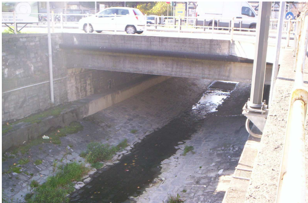
F1 - DOCUMENTAZIONE FOTOGRAFICA